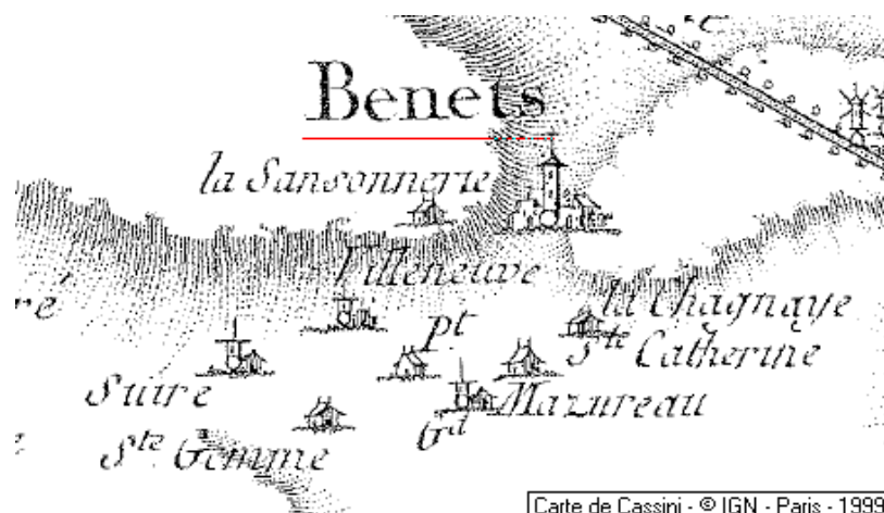
Localisation: Maison du Temple de Benet et Sainte-Gemme