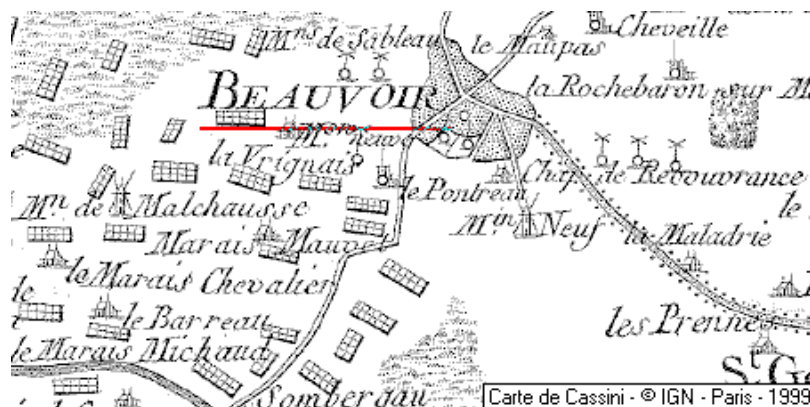
Localisation: Bien du Temple à Beauvoir sur Mer