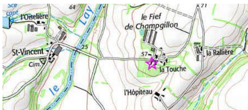
Maison du Temple de Champgillon

Département: Vendée, Arrondissement: Fontenay-le-Comte, Canton: Sainte-Hermine, Commune: Saint-Juire-Champgillon - 85