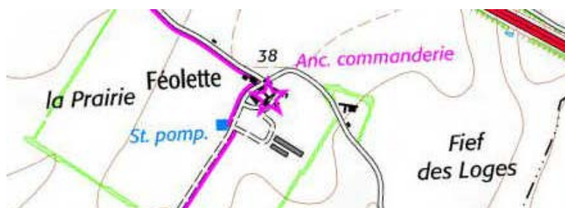
Localisation: Maison du Temple de Féolette

Département: Vendée, Arrondissement: Fontenay-le-Comte, Canton: Sainte-Hermine, Commune: Saint-Etienne-de-Brillouet - 85