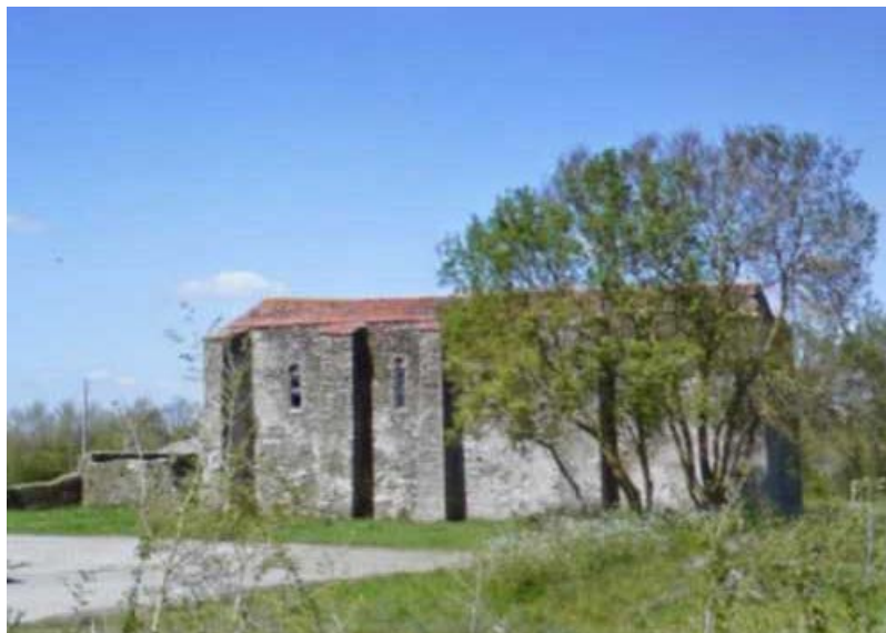
Chapelle du Temple de Coudrie

Monument classé datant du XIIe siècle et remanié au XVe siècle, cette ancienne église se situe non loin du village de la Flocellière, près de la route qui mène à Saint Christophe du Ligneron.