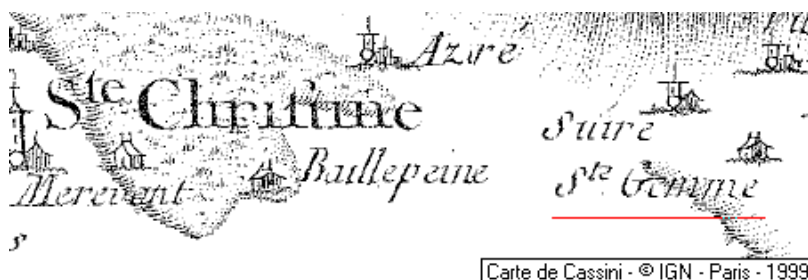
Localisation: Domaine du Temple de Sainte-Gemme

Département: Vendée, Arrondissement: Fontenay-le-Comte, Canton: Maillezais, Commune: Benet - 85