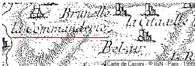
Localisation: la Réorthe, la Commanderie