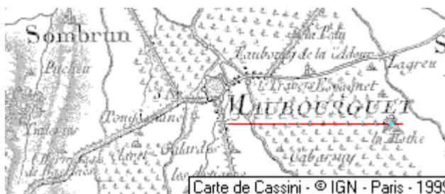
Localisation: Domaine du Temple à Maubourguet

Département: Hautes-Pyrénées, Arrondissement: Tarbes, Canton: Maubourguet - 65