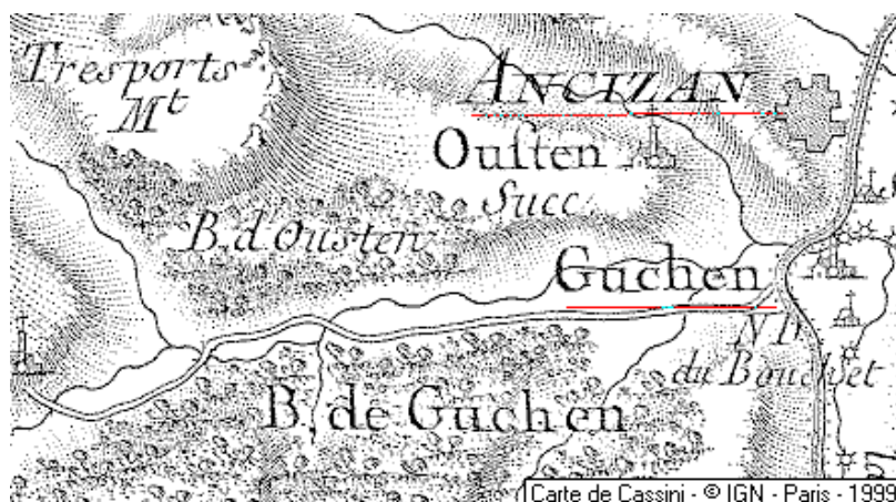
Domaine du Temple à Ancizan

Département: Hautes-Pyrénées, Arrondissement: Tarbes, Chef-lieu de cantons, Commune: Ancizan - 65