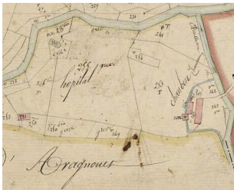
Cadastré de l'Hôpital de Chaubère - Sources: Aragnouet

En sortant d'Aragnouet, on passe de nouveau la rivière, où la digue d'un moulin forme une jolie cascade, et près de là est la source sulfureuse et froide de la Queau, au pied de la forêt dû même nom. Bientôt la vallée se rétrécit, pour fermer le bassin au centre duquel est située la maison de Chaubère, qui sert d'hospice aux voyageurs.