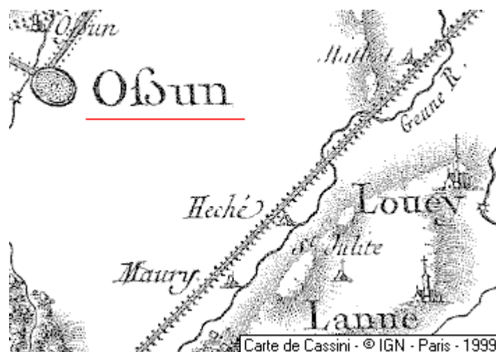
Localisation: Seigneurie du Temple d'Ossun

Département: Hautes-Pyrénées, Arrondissement: Tarbes, Canton: Ossun - 65