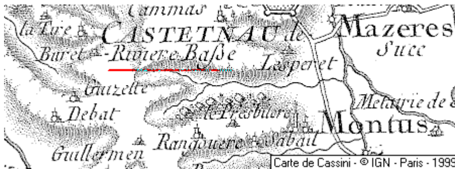
Localisation: Domaine du Temple de Castelnau-Rivière-Basse

Les religieux de cette corporation guerrière (les Templiers) n'entrèrent dans le diocèse de Tarbes qu'un demi siècle plus tard que les Hospitaliers de Saint-Jean.