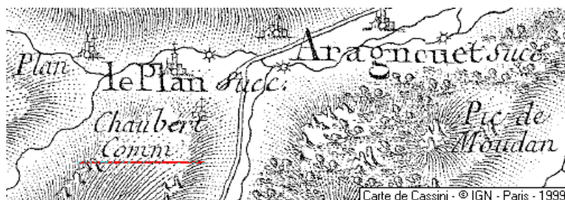
Hôpital de Chaubère

Département: Hautes-Pyrénées, Arrondissement: Bagnères-de-Bigorre, Canton: Vielle-Aure, Commune: Aragnouet - 65