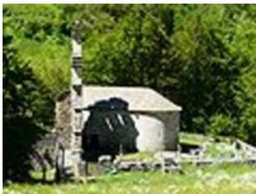
Chapelle des Templiers d' Aragnouet

Les aragonais venaient ramasser le foin en France et les français partaient en Espagne cueillir les olives (ou pour échapper à la conscription).