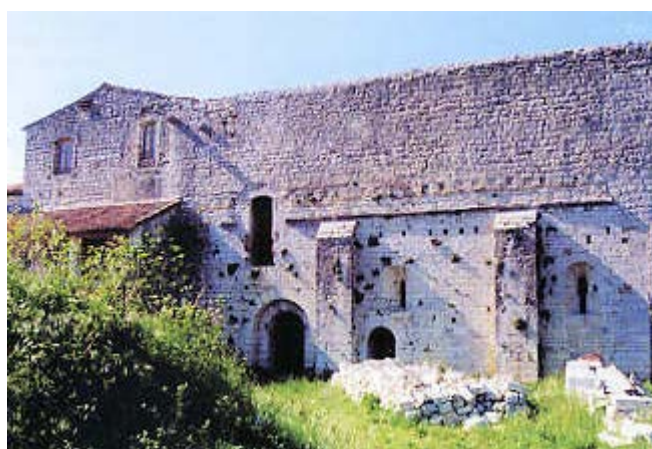
Localisation: Chapelle du Temple de Jalès

D. Le Blévec, « La seigneurie », p. 45-46.